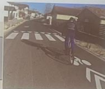
av. Mal de Latre de Tassigny